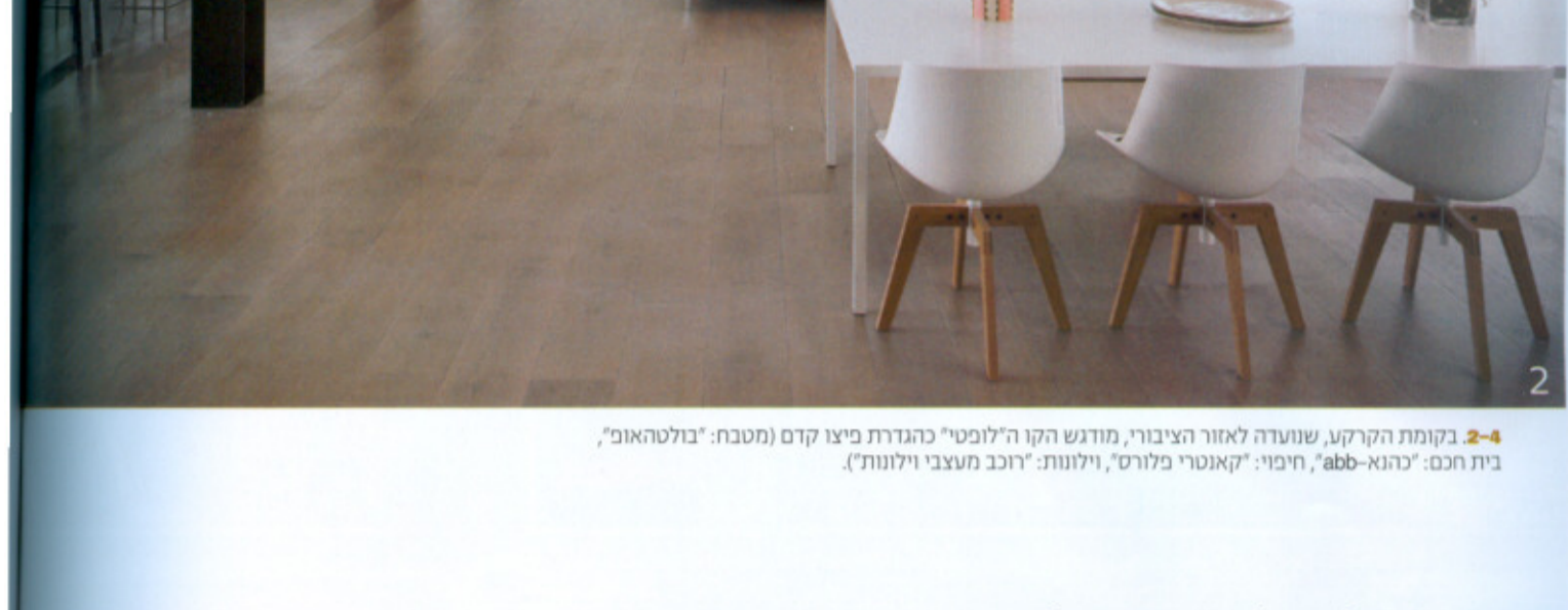
2-4 בקומת הקרקע, שנוצרה לאזור ה"בנין", מודשש הקו ה"פוסט" מחדרת קצו (מסכה) "בולטהאוס", בית הכנסת - "אבא-אבא", ופייס "קואטר מלורס", ו"זשוזות" (דוכן משיבו לזיהוי).

שיתופי פעולה מוצלחים בין אדריכלים בישראל אינם דבר שכיח. סיבה אחת היא הסכנה של תחרותית מאוד רחב וזו אינה אחרת וזמורה קטנה כמו ישראל המקום המפחד לאדריכלים לכבוש את החלק מהמרחב שהם רוצים לבנות. המדריכוס עולמים שני אדריכלים מהשורה הראשונה אחד מהם ממנה המסלול, ביניהם הוא חבית שיעצבו יוני מונז'ק ופיצוקים ונועה גרוסן. נעשה ועלשה נדל"ת במוקדם במרחב הארץ בדולתו של שיתוף הפעולה בין מונז'ק למנטאנס בראש ובראשיתו ככל שגורא אינו יוכר. כלומר, על אף שלא של אדריכלים בעלי סגנונות שונים לחלוטין, נשקף עד בלתי אפשרי להבחין בשני בעלי מקצוע רחוקים לכך באופיים זה מזה ספקי סגנונות, או כפי שהקורא זאת מונז'ק: "פיצוקים לקח את העניין שלי והמשיך את הקו".